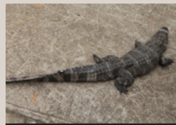
Alligator équipé d'un émetteur sur la queue avant d'être relâché

Cet été, six alligators ont été sélectionnés dans le centre d'élevage après avoir été soumis à une série de tests de santé (mesure de la taille, des différentes parties du corps, examen des traumatismes éventuels). Les 2 mâles et 4 femelles concernés ont été équipés d'émetteurs radio pour assurer leur suivi scientifique avant d'être relâchés sur le site de Gaojingmiao, restauré en 2011.