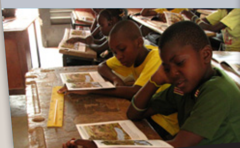
Distribution du livret dans les écoles des Balé, (© Julien Marchais, Des Eléphants & des Hommes)

Pour la première fois, le livret pédagogique « Mon Voisin Éléphant » de l'association Des Eléphants & des Hommes a été introduit dans toutes les écoles primaires de la province des Balé, ainsi que dans une partie des écoles du Mouhoun : plus de 9000 enfants sont ainsi sensibilisés à la protection des éléphants !