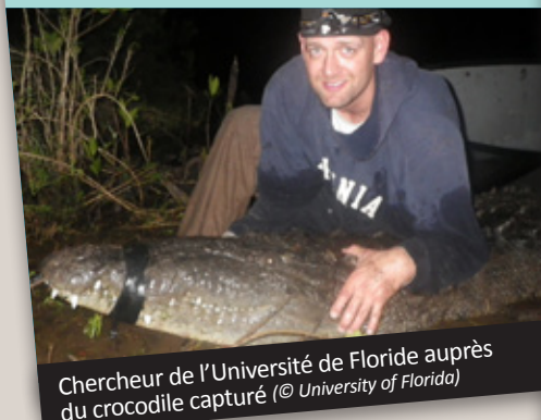
Chercheur de l'Université de Floride auprès du crocodile capturé

Le crocodile capturé et marqué par l'équipe de l'Université de Floride mesurait exactement 4,11 mètres, soit seulement 5 cm de moins que le plus gros jamais attrapé. Une belle prise encourageante quant à l'espérance de vie des crocodiles dans les Everglades.