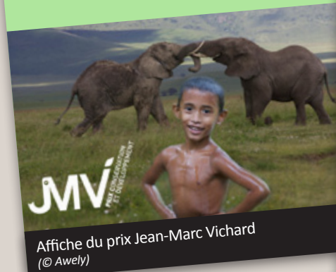
Affiche du prix Jean-Marc Vichard

Awely, partenaire du FDB pour la conservation du rhinocéros unicolore au Népal est à l'origine de ce prix qui vise à récompenser une personne dont le travail de terrain crée un impact positif significatif et remarquable sur la conservation des espèces animales menacées, par l'utilisation notable d'actions de développement. Pour plus d'information rendez-vous sur http://www.awely.org/fr/prix-jmv.html