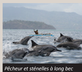
Pêcheur et sténelles à long bec à Mayotte

Après deux premières sorties en mer « bredouilles », les jeunes ambassadeurs de l'association Megaptera ont enfin pu observer les dauphins de Mayotte ! Ils ont rencontré un groupe de 200 sténelles à long bec lors de la sortie d'octobre, puis deux groupes différents de grands dauphins lors de la sortie de novembre. Les jeunes ambassadeurs ont mis à profit leur apprentissage de la photo-identification : la prise de clichés des grands dauphins s'est avérée plus facile que celle des sténelles qui ont pour caractéristique de sauter en vrillant !