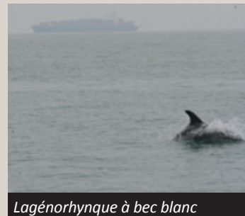
Lagénorhynque à bec blanc observé le 19 octobre dernier

En raison des dépressions automnales du Nord de la France, les sorties en mer avec le bateau d'OCEAMM se font rares. L'association collabore donc avec une compagnie maritime transmanche afin de bénéficier de leur ferry comme plateforme d'observation. En octobre et novembre, les 7 sorties effectuées ont permis d'observer 57 marsouins communs mais aussi, fait plus rare, un groupe d'une vingtaine de Lagénorhynques à bec blanc.